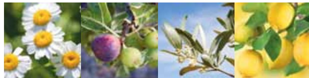
Camomille romaine Roman chamomile Camomila romana