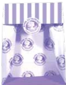
Sachet cadeaux / Select gift pouch / Sobre de regalo (17cm x 23cm) inclus papier de soie et autocollant includes decoration paper and closing sticker que incluye papel de seda y autoadhesivo X 100 : KITAC003