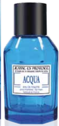
Acqua 100ml PF02036