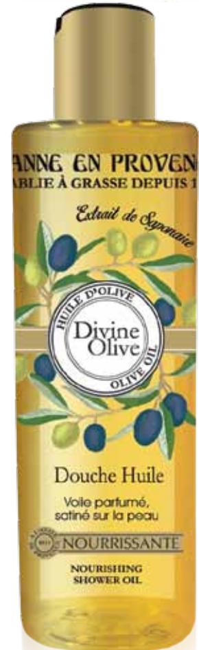
Douche huile Shower oil Aceite de ducha 250ml PF24309