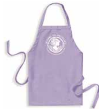
Tablier authentique pour animatrice Authentic apron for animator Auténtico delantal para la animadora ACC00181