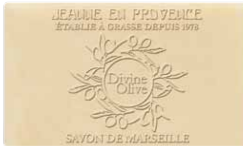
Savon solide Solid soap Jabón sólido 100g PF02275