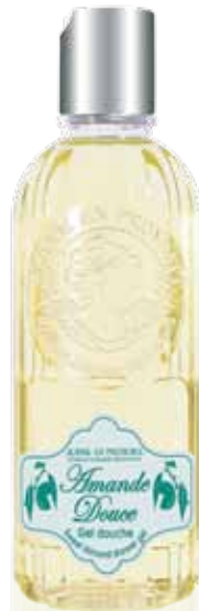
Gel Douche Shower gel Gel de ducha 250ml PF02199