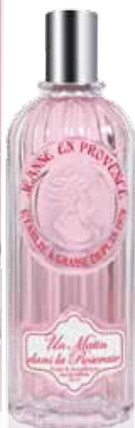
Eau de Parfum Un Matin dans la Roseraie Rose & Angélique / Rose & Angelica / Rosa y Angélica 125ml PF01383 / 60ml PF01384