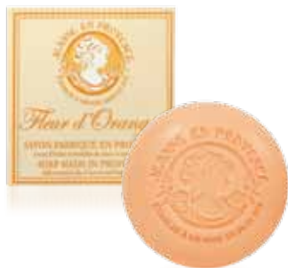
Savon solide Solid soap Jabón sólido 100g PF01646