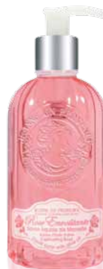
Savon liquide de Marseille Liquid soap of Marseille Jabón líquido de Marsella 300ml PF01603