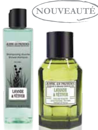
Lavande & Vétiver / Lavender & Vetiver / Lavanda y Vetiver PF02146 Shampooing Douche / Shower shampoo 250ml PF02175 Eau de Toilette pour homme / for men / para hombre 100ml