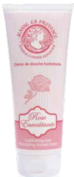
Crème de douche hydratante Moisturizing shower cream Crema de ducha 200ml PF01727