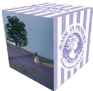
Cube / Cubo (21cm x 21cm) DE00248