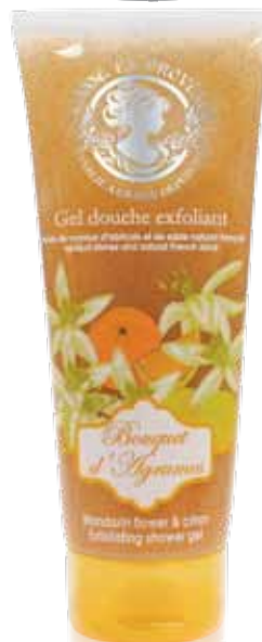
Gel douche exfoliant Exfoliating shower gel Gel de ducha exfoliante 300ml PF02210