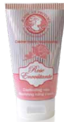
Crème mains nourrissante Nourishing hand cream Crema reparadora para las manos 75ml PF01722