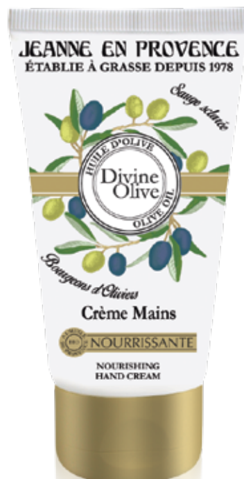
Crème mains nourrissante Nourishing hand cream Crema reparadora para las manos 75ml PF02273