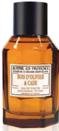
Bois d'Olivier & Cade Olive Wood & Juniper Madera de Olivo y Enebro 100ml PF01388