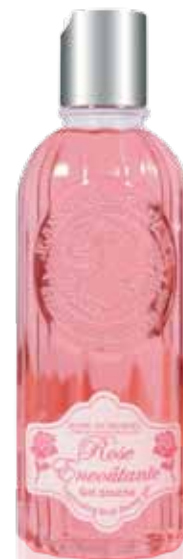
Gel Douche Shower gel Gel de ducha 250ml PF01604 50ml PF01624