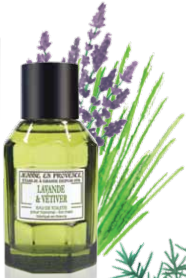
Lavande & Vétiver Lavender & Vetiver Lavanda y Vetiver 100ml PF01387