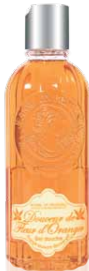
Gel Douche Shower gel Gel de ducha 250ml PF01426