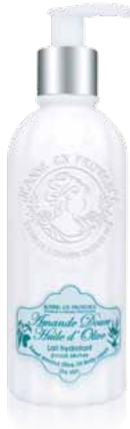
Lait hydratant pour le corps Moisturizing body cream Leche corporal 250ml PF01641 50ml PF01721