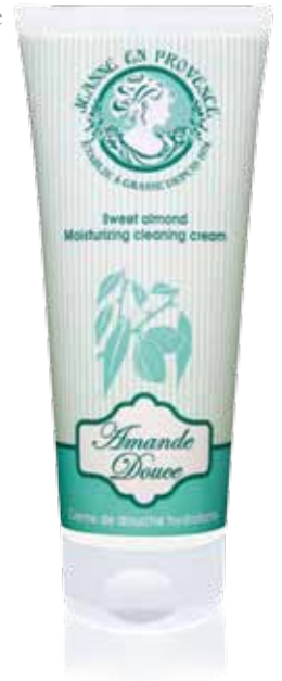
Crème de douche hydratante Moisturizing shower cream Crema de ducha 200ml PF01438