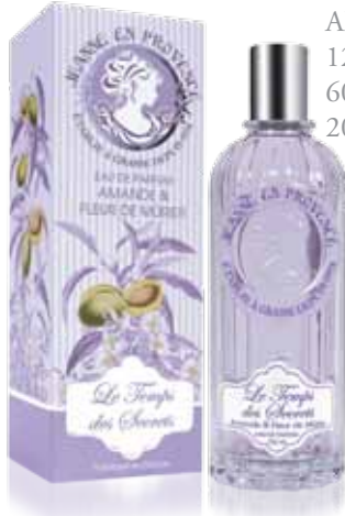
Le Temps des Secrets Amande & Fleur de Mûrier Almond & Blackberry Bush Flower Almendra y Flor de Mora 125ml PF01379 60ml PF01380 20ml PF01428