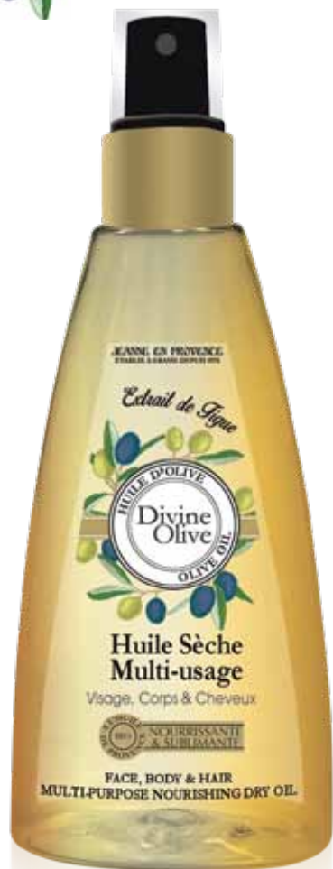
Huile sèche multi-usage visage, corps & cheveux Face, body & hair multi-purpose dry oil Aceite seco para la cara, el cuerpo y el cabello 75ml PF02261