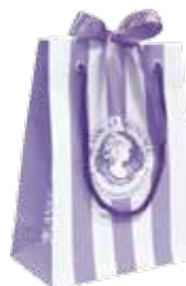
Petit sac Small shopping bag Pequeña bolsa (14cm x 19cm) AC00089