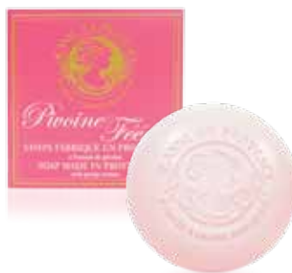
Savon solide Solid soap Jabón sólido 100g PF01956