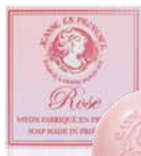
Savon solide Solid soap Jabón sólido 100g PF01550