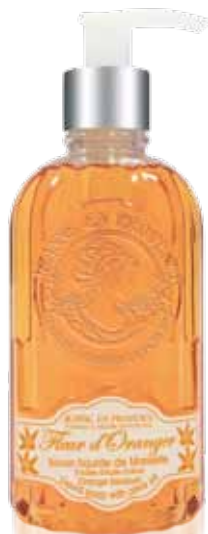
Savon liquide de Marseille Liquid soap of Marseille Jabón líquido de Marsella 300ml PF02247