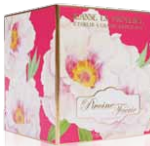
Pivoine Féérie / Peony / Peonía 50ml PF01819