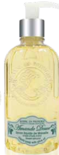
Savon liquide de Marseille Liquid soap of Marseille Jabón líquido de Marsella 300ml PF02140