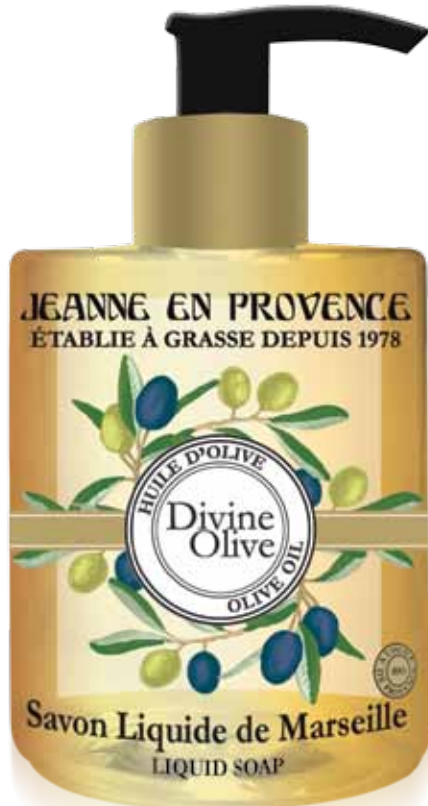
Savon liquide de Marseille Liquid soap of Marseille Jabón líquido de Marsella 300ml PF02274